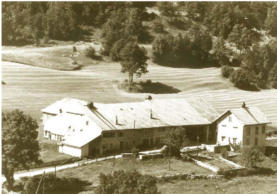
L'Épine-Dessus vers 1960. Le grand voisinage + la villa (La Verrue) sont propriétés de Emile Rochat dit Millet.

Il convient maintenant de retrouver l'Épine en images, son histoire, très complexe, et surtout très longue, ne pouvant trouver place ici.