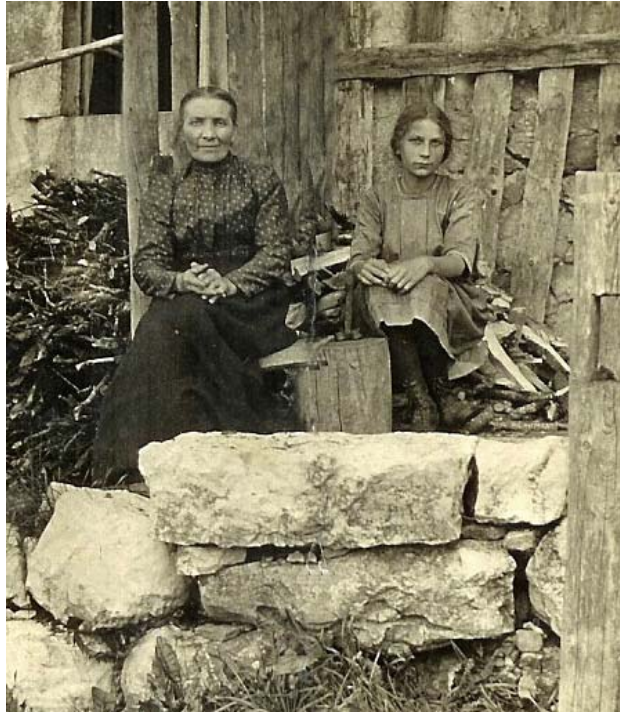
Personnages de l'Épine-Dessous de bise alors que les deux parties étaient encore séparées.