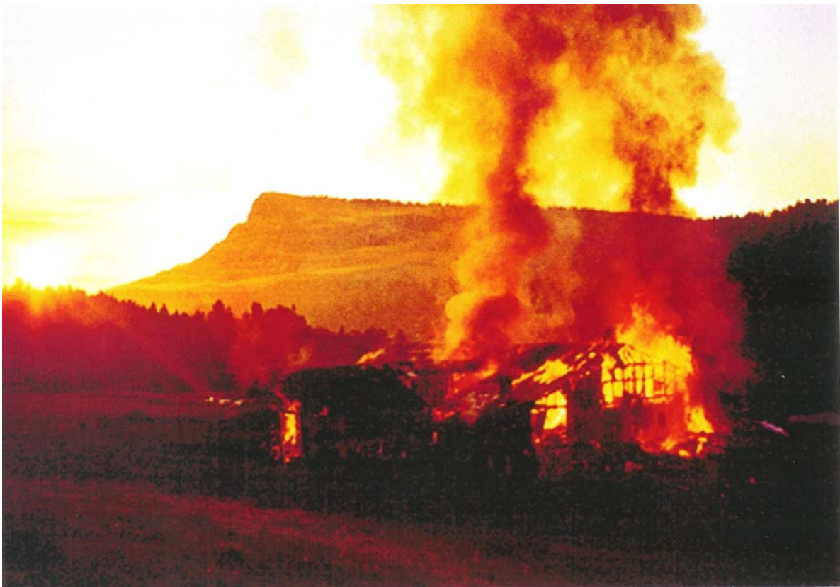
Incendie de l'Epine-Dessus en juin 2000.