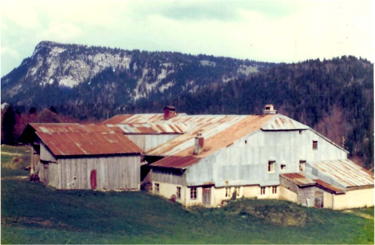
L'Epine-Dessus, les deux parties, vers 1970.