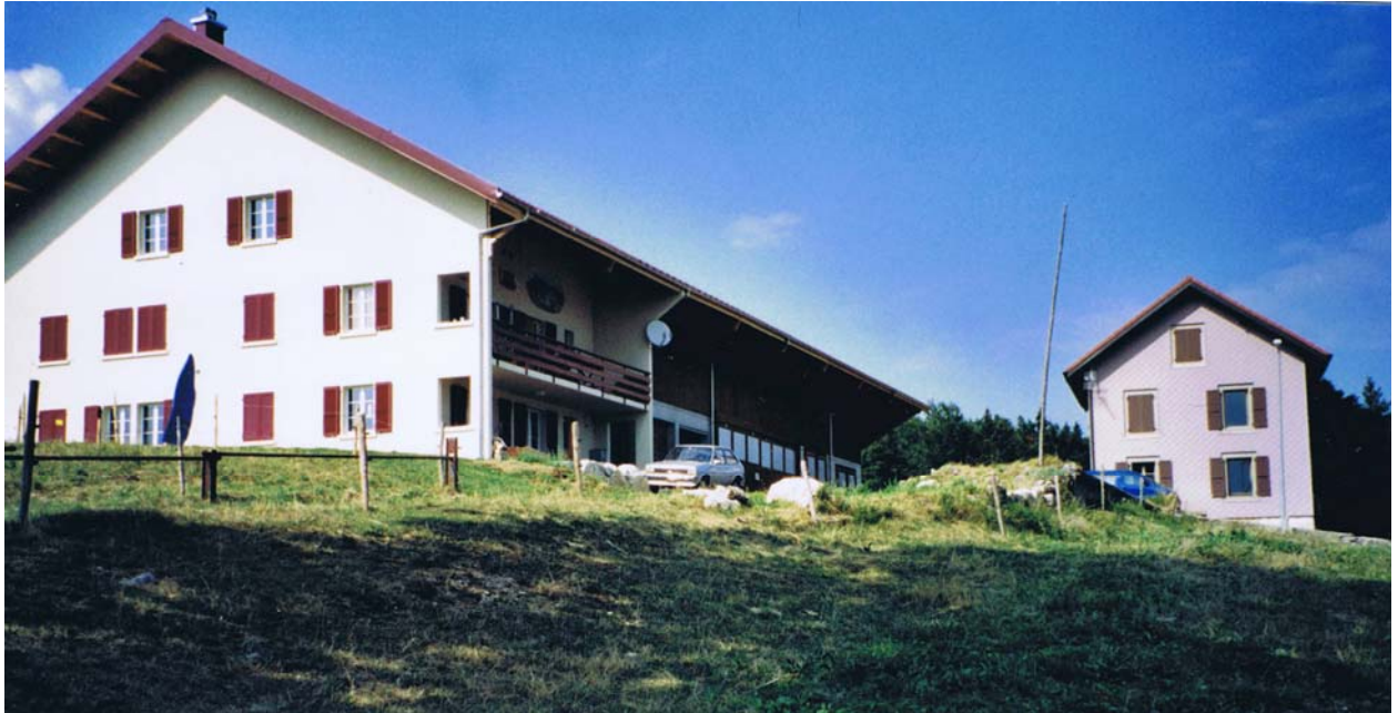
Feu le grand voisinage, remplacé par une maison d'habitation doublée d'une vaste ferme. La Verrue est toujours là, ayant échappé par miracle à l'incendie.