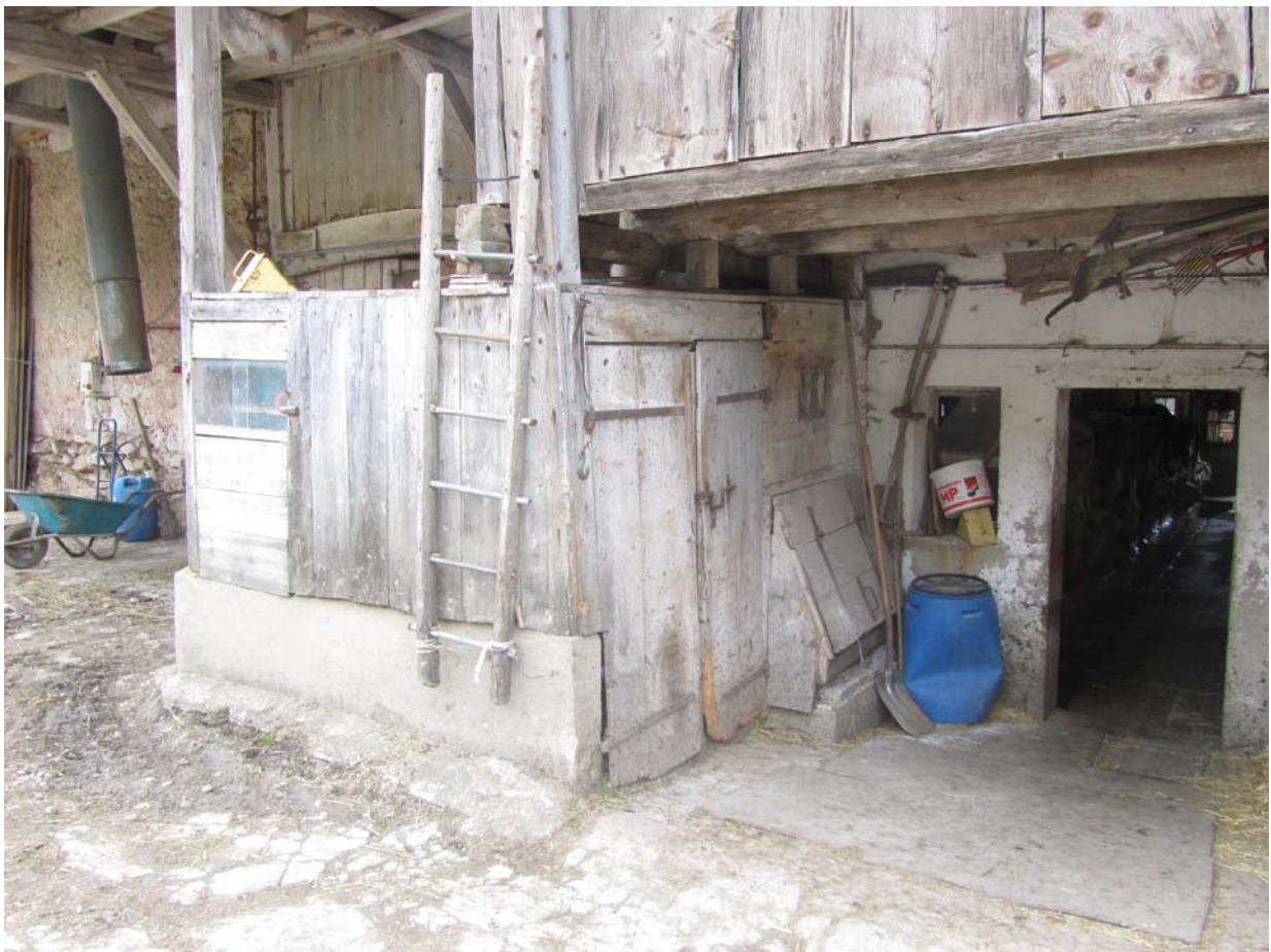
Le néveau arrière de l'Épine-Dessous. Il date de 1780, année où les deux bâtisses furent reconstruites suite à un incendie.