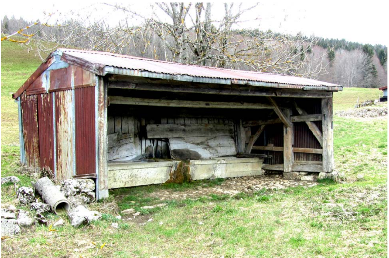
La fontaine à vent de l'Epine-Dessus. Elle sert, ou plutôt servait, pour les deux voisinages.